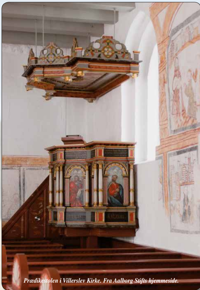
Prædikestolen i Villerslev Kirke.