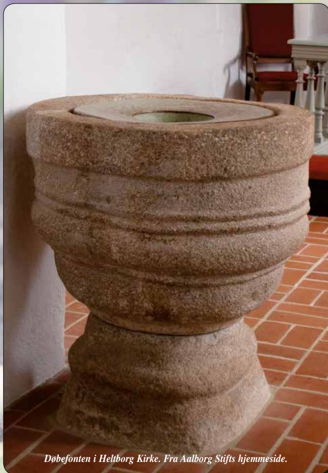
Døbefonten i Heltborg Kirke.