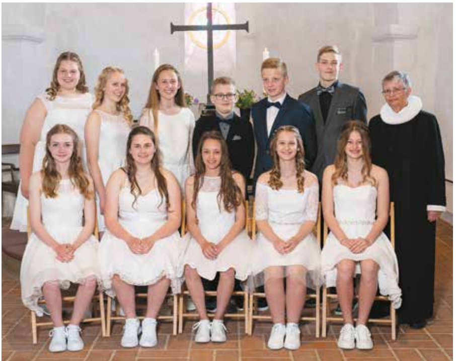
Konfirmander fra Hørdum Kirke 13. maj.