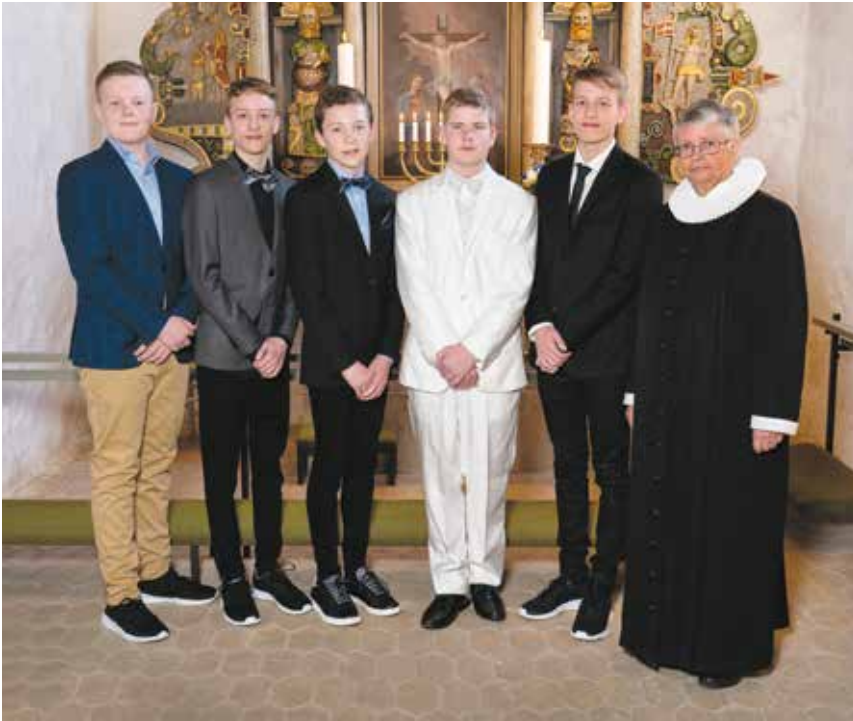
Konfirmander fra Hassing Kirke 6. maj.