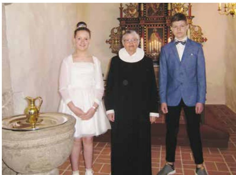
Konfirmander fra Visby Kirke 29. april.