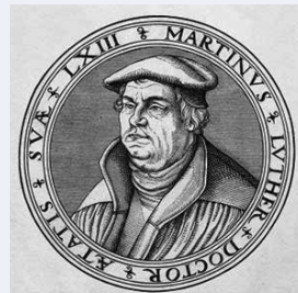
Atatis suæ LXIII = 63 år