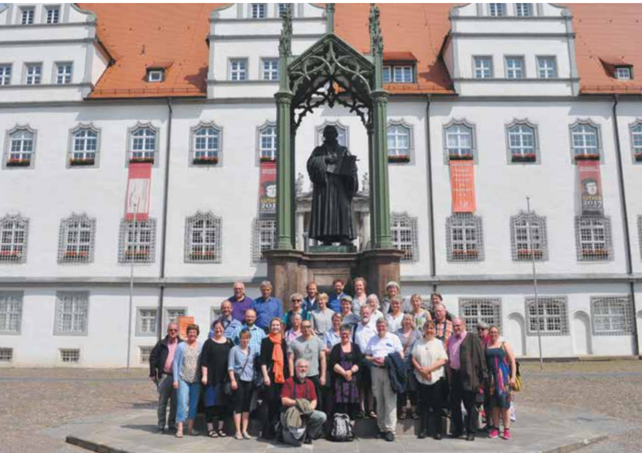
Præster fra Thy og Mors foran Lutherstatuen på pladsen foran Wittenberg Rådhus.