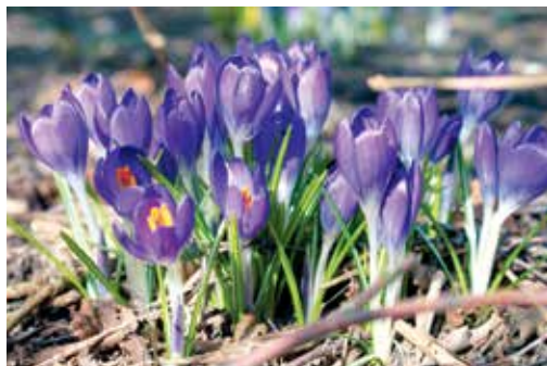
Forsiden: Maleri af Kristine Frøkjær 2012.