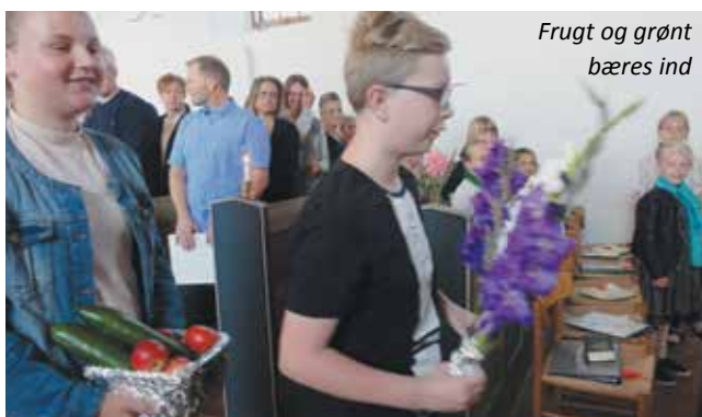
Frugt og grønt bæres ind