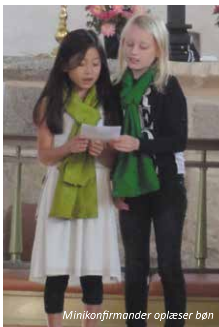
Minikonfirmander oplæser bøn