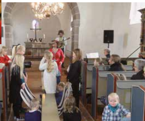
Familiegudstjeneste med tante Andante