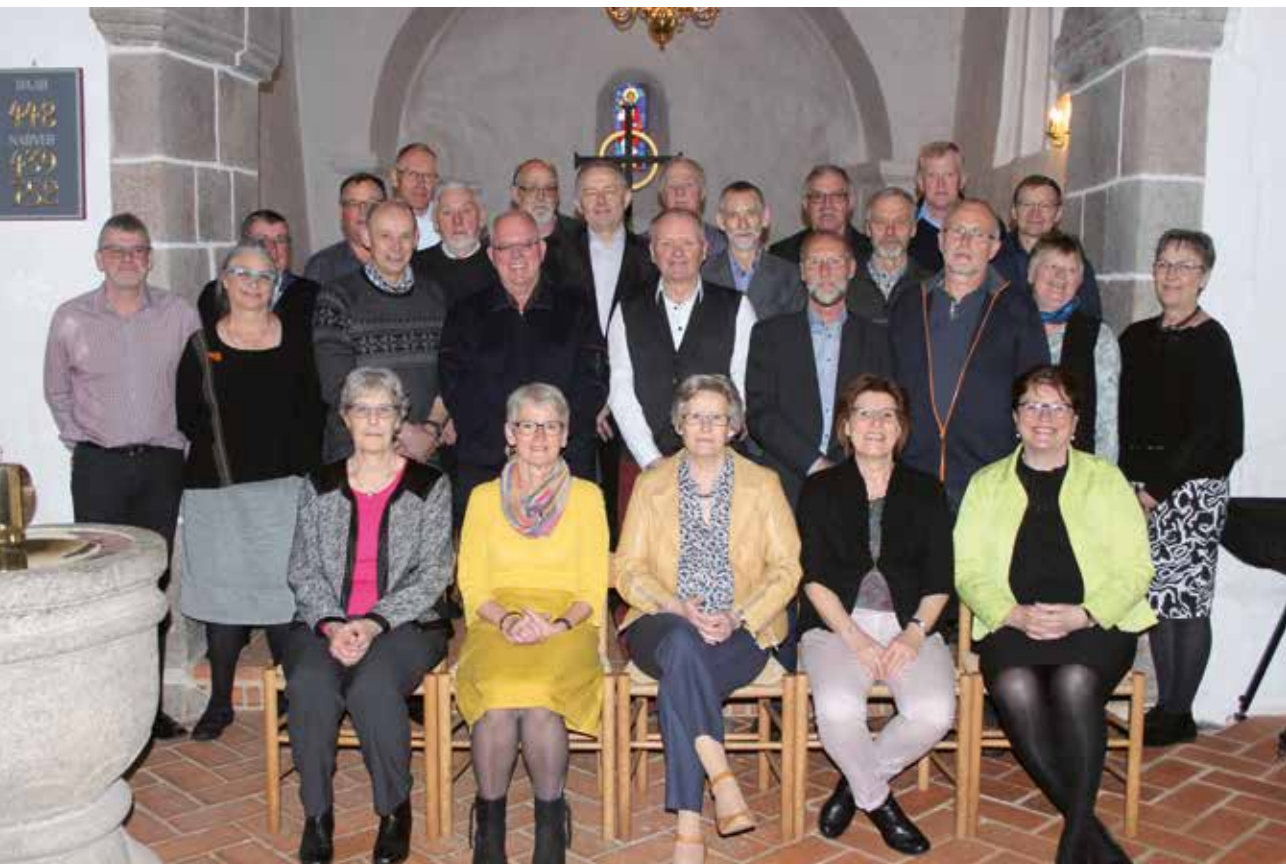
Guldkonfirmander fra Hørдум og Skyum i Hørдум Kirke den 16. april 2016